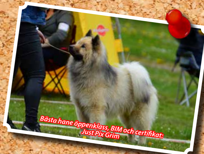
Bästa hane öppenklass, BIM och certifikat: Just Pix Grim