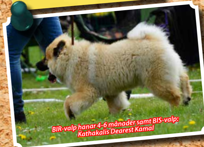
BIR-valp hanar 4-6 månader samt BIS-valp: Kathakalis Dearest Kamal

Nedan följer en presentation av vinnarna inom respektive klass.