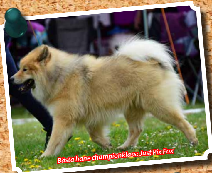
Bästa hane championklass: Just Pix Fox

Domarna tog sig tiden att ge en utförlig kritik till samtliga ekipage. Det blev en lång dag tyckte några av de fyrbenta besökarna.