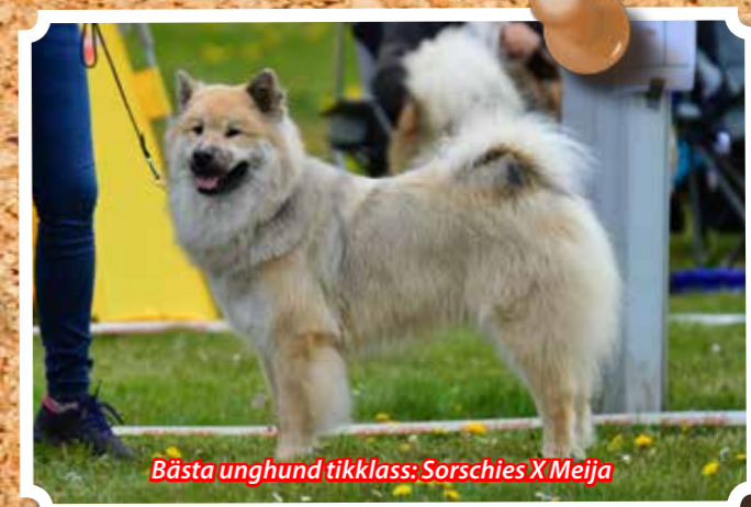
Bästa unghund tikklass: Sorschies X Mejja