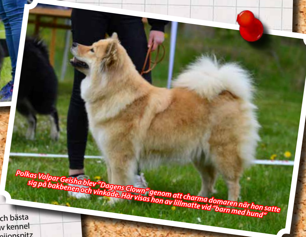
Polkas Valpar Geisha blev "Dagens Clown" genom att charma domaren när hon satte sig på bakbenen och vinkade. Här visas hon av lillmatte vid "barn med hund"

Efter lunchen hölls bästa avelsgrupp och bästa uppfödargrupp. Bägge klasser vanns av kennel Twin Dogs. Avelsgruppen med tiken Leiiionspitz Unforgettable Ullis och uppfödargruppen med två avelskombinationer.