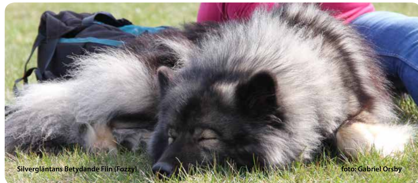
Silvergläntans Betydande Fiin (Fozzy)