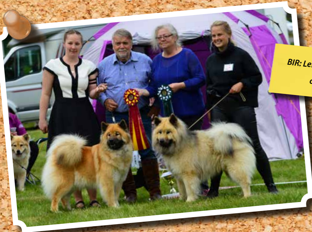
BIR: Leionspitz Unforgettable Ullis och BIM: Just Pix Grim

Nedan följer en presentation av vinnarna inom respektive klass.