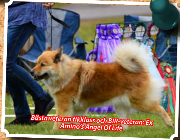
Bästa veteran tikklass och BIR-veteran: Ex Amino's Angel Of Life