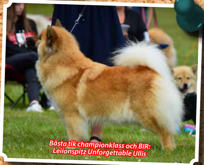
Bästa tik championklass och BIR: Leiiionspitz Unforgettable Ullis