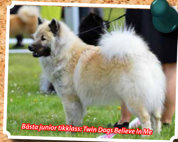
Bästa junior tikklass: Twin Dogs Believe In Me