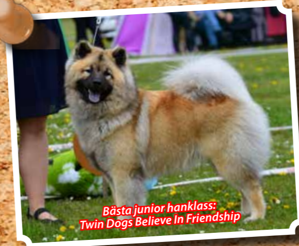
Bästa junior hanklass: Twin Dogs Believe In Friendship