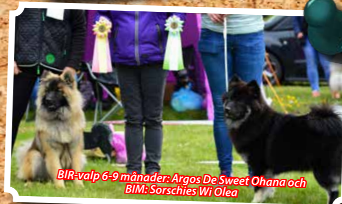
BIR-valp 6-9 månader: Argos De Sweet Ohana och BIM: Sorschies Wi Olea