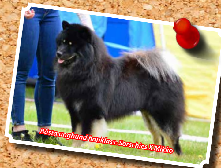
Bästa unghund hanklass: Sorschies X Mikko