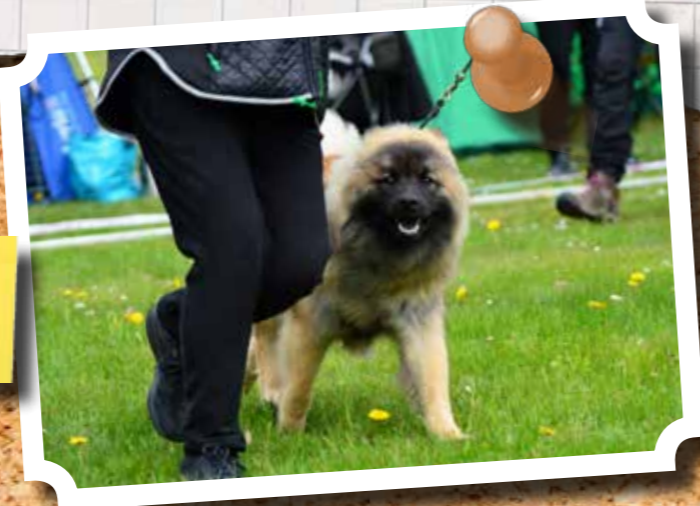
Himla spännande med en fotograf tyckte flera av hundarna!

Lördag den 18:e maj var det äntligen dags, årets Eurasierspecial drog igång! Utställningen hölls på Västervik Resort i Småland och planerades starta klockan tio. Redan vid åtta var så gott som alla på plats: drygt 100 eurasier med deras glada mattar och hussar. Som vanligt när det samlats många eurasier på en och samma plats slogs man över hur förhållandevis lugnt det ändå var, knappt några skall hördes och ett förväntansfullt lugn rådde. Liksom tidigare år hade många besökare rest långvägars tvärs över landet och övernattnat på campingen eller i husbil. De två utställningsringarna var vackert prydda av maskrosor och runtomkring stod färgglada utställningstält tätt. Vädret bjöd på drygt 15 grader och disig sol, skönt tyckte både två- och fyrbenta besökare.