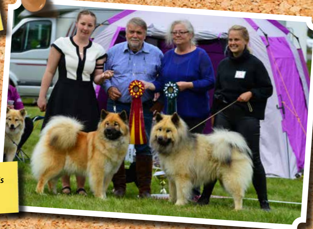
BIR: Leiiospitz Unforgettable Ullis och BIM: Just Pix Grim

Avslutningsvis hölls finalerna. Stort grattis till alla vinnare och inte minst alla deltagare för fantastiskt fina och trevliga hundar! Eloge till Eurasierklubben som ordnat med en sådan fin tävling och tjugiga rosetter till samtliga ekipage.