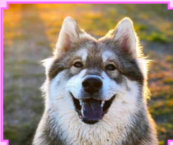
Wirosas Double Touch (Asta) 8 mån.