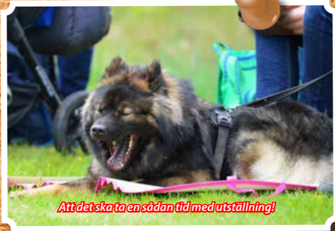
Att det ska ta en sådan tid med utställning!